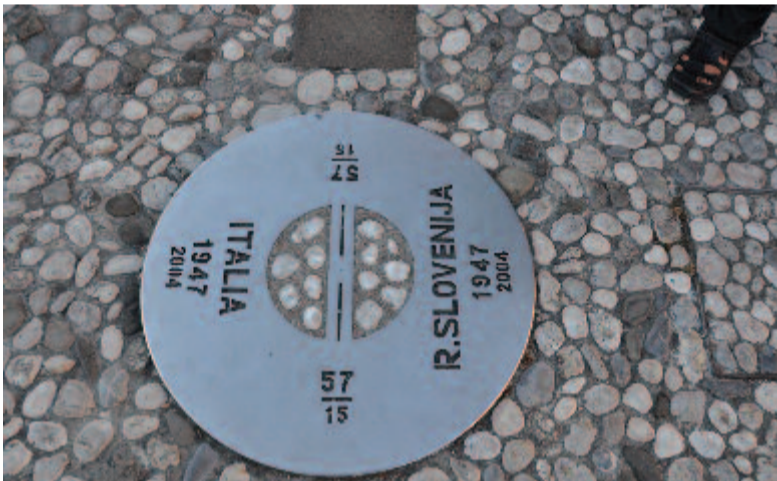
Határkő a szlovén Európa téren

egyik kanálsídfő fölött sokan fotózkodnak terpeszállásban. Közélebb lépve látom, hogy alig pár méterre az állomásépülettől van a szlovén–olasz határ. Ezt jelzi a Piazza del Transalpina téren elhelyezett kerek fémplakett.