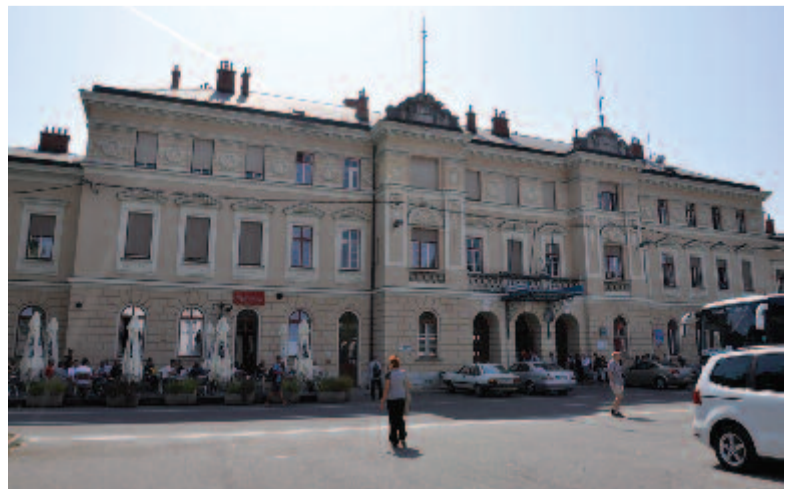
Nova Gorica állomásépülete