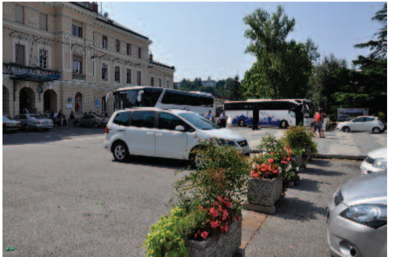
A szlovén–olasz határt jelző virágcserépek a Transalpina téren

A torony tetejéről gyönyörű a kilátás az Isonzó, a Vipava völgyére, de ellátni a Dolomitokig és a Júliai Alpokig, a másik frontvonalat jelölő Triglav-csúcsokig, a másik oldalon pedig az Adriai-tengerig. Alig egy kilométernyire van a 150 méter hosszú Pečinka barlang. Ebben őskori kerámiatöredéket és emberi maradványokat is találtak. Azonban az első világháborúban pihenő-, óvóhelyként használta az osztrák–magyar hadsereg, majd 1916 novemberében az olaszoké lesz 1917 októberéig. Ma a barlang egy részében rekonstruálták a katonák számára elhelyezett emeletes ágycsészéket és a tiszteknek járó fülkéket, valamint a Pečina csúcsán levő, fényszóróval ellátott megfigyelőponton. Ettől nem messze volt a Segeti-tábor, ahova a csaták után visszahúzódtak pihenni a katonák. Itt többek között mozi, kuglipálya, kávézó, hajóhinták, ringlispil, teniszpályák, kápolna, gondosan elrendezett pihenőhelyek, park várta a katonákat és a