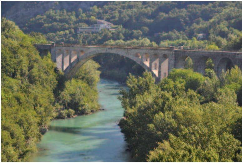
A Solkan híd

Impozáns, osztrák–magyar monarchiabeli állomásépület fogad. Előtte régi gőzmozdony emlékmű. Több autóbusz várja a fáradt utasokat, hogy a városban levő szállodákba szállítsa. Miközben sokan saját szállítóeszközeiket keresik, arra leszek figyelmes, hogy az