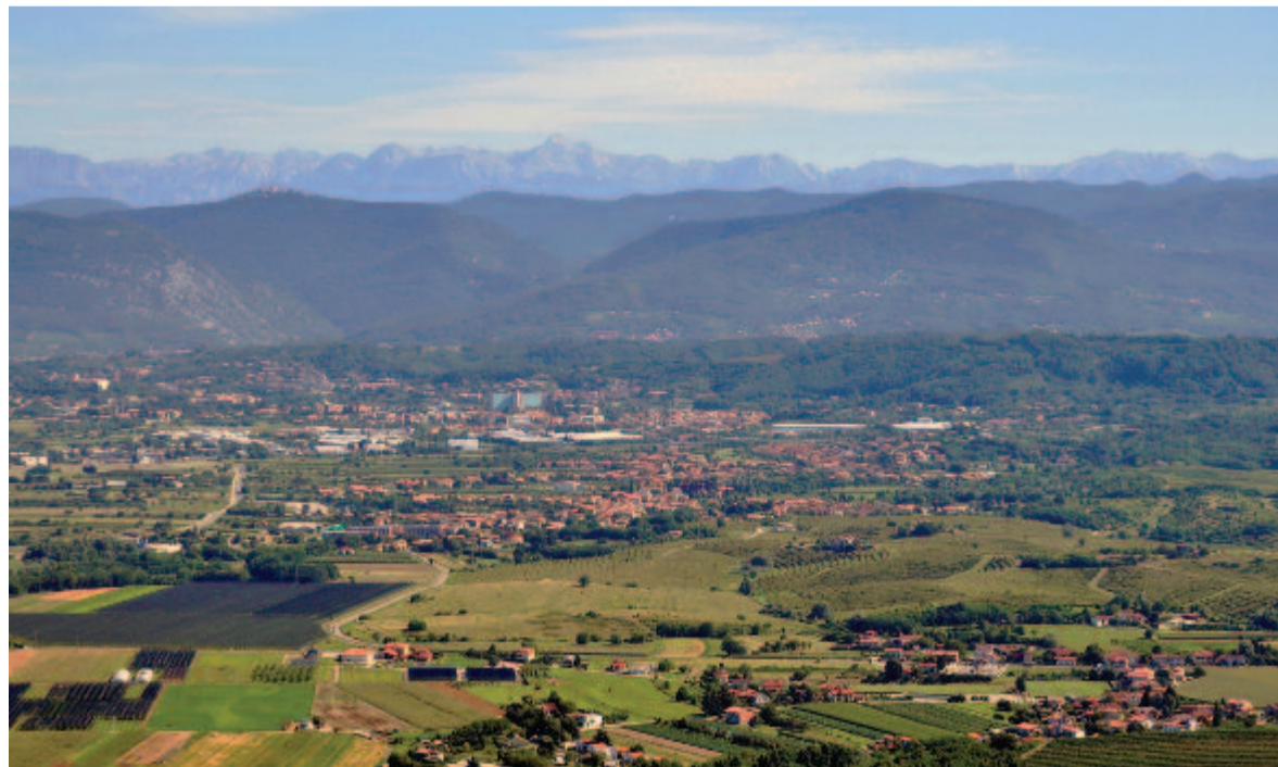
Az Isonzó völgye

Megtudtuk, hogy az itteni magaslatt birtoklásáért is hónapokig tartó kemény csata folyt. Ahogy figyelmesebben körülnézünk, valóban olyan a fehér sziklával borított – mára már cserjékkel fedett – terület, mint a hullámzó tenger felülete. A béke ösvénye jelzést követve egy kicsit szétnézünk a terpen. A bokrok alatt kőhalmokat, egykori lőállásokat vélünk felfedezni. Száz évvel ezelőtt csak a fű és a pusztaság fehér kövek uralták a tájat.